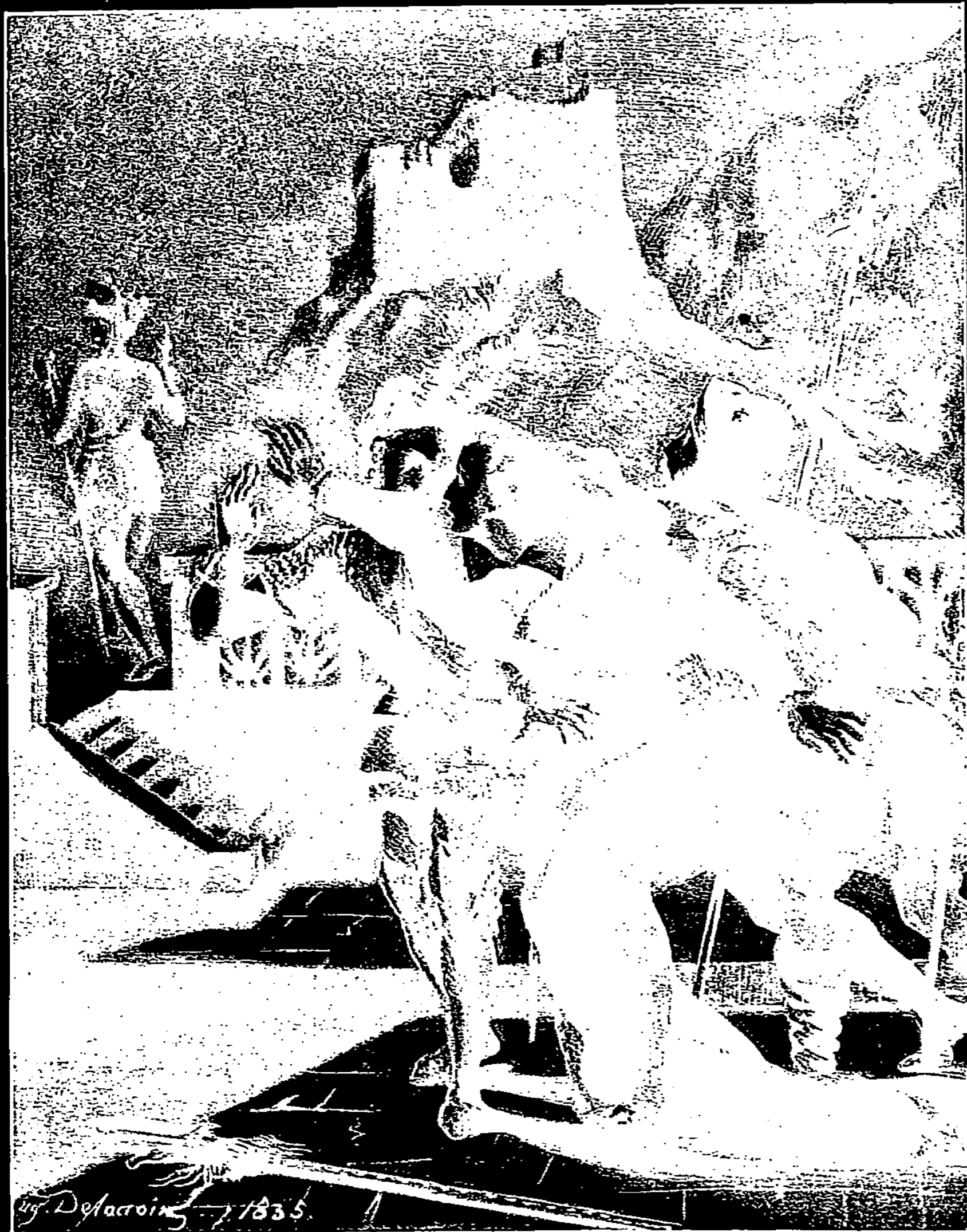
SCÈNE D' « HAMLET »

Il n'est plus besoin, aujourd'hui, de réfuter ces sarcasmes. Des