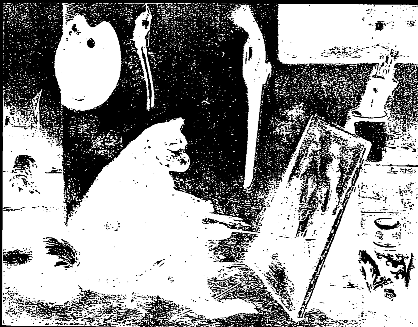
LE SINGE PEINTRE, PAR DECAMPS (Musée de Louvre.)

l'on veut, son incapacité à s'intéresser aux choses mêmes, éclatent lorsqu'il prend point de départ dans la réalité présente. Il décrit des scènes de chasse, peint des paysans, pénètre dans une sacristie, dans une taverne ou s'arrête dans les rues; on ne peut, semble-t-il, côtoyer de plus près le réalisme. Il en reste, cependant, tout à fait éloigné, parce que jamais il ne se soucie d'être exact, jamais il n'essaie de saisir le sens intime de la scène dont il s'empare; il pro-