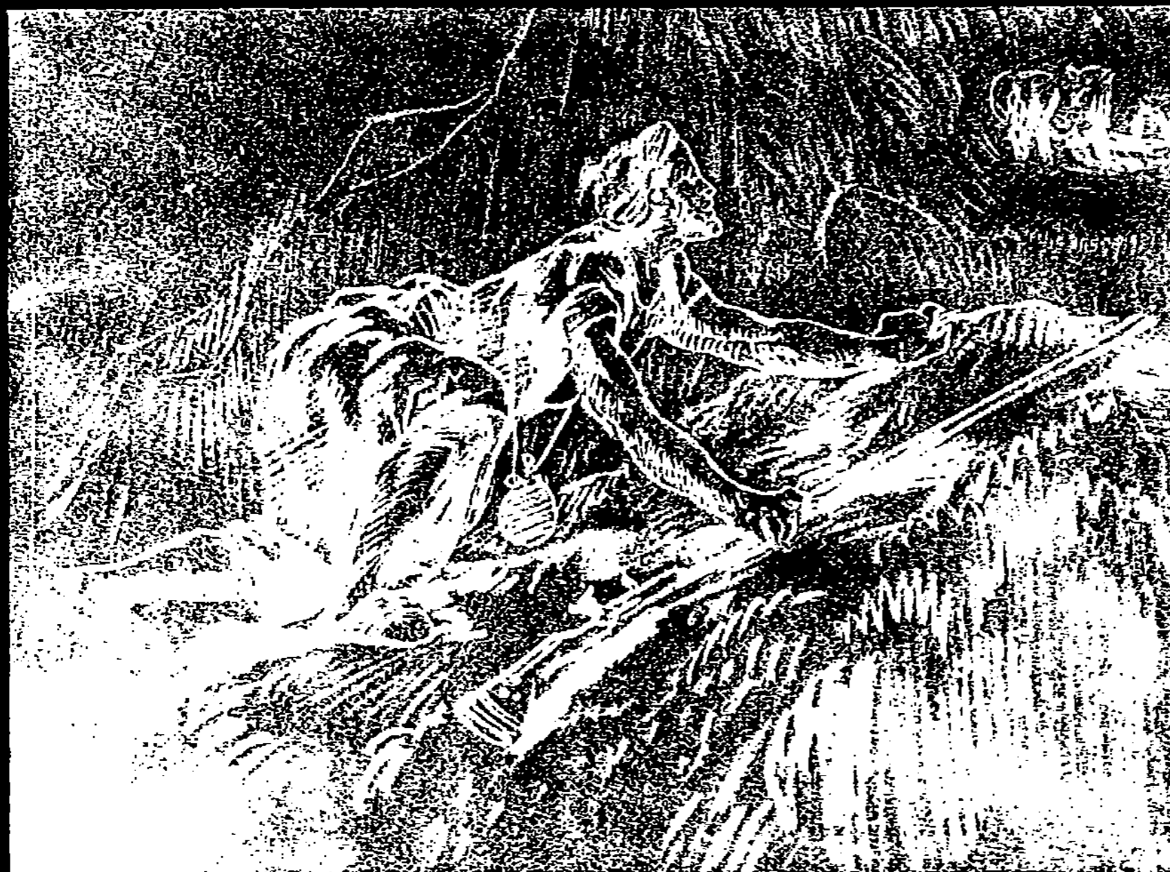
ARABE A L'AFFÛT, DESSIN PAR EUGÈNE DELACROIX (Musée du Louvre.)

Quelques-uns ont essayé d'analyser l'impression produite par ses œuvres, et ils ont reconnu qu'ils étaient moins touchés par des