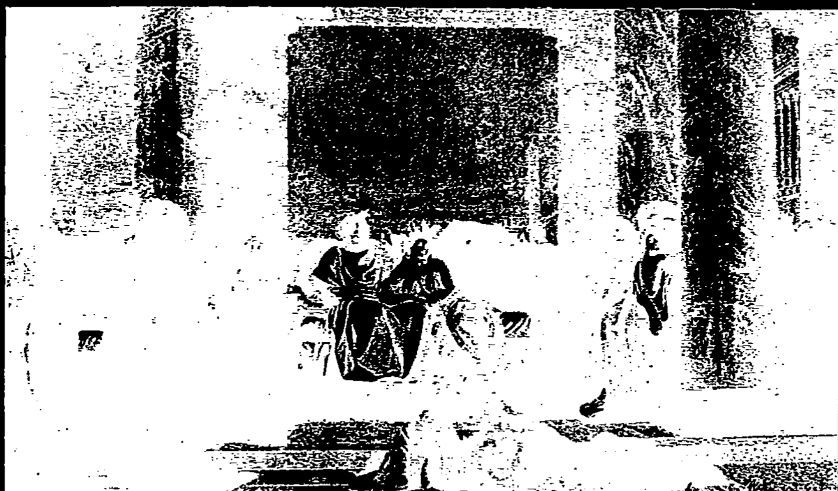
ANTOINE ET CLÉOPÂTRE APRÈS LA BATAILLE D'ACTIUM

On connaît l'évolution de Théodore Chassériau 1 . Notre dessein n'est pas de la raconter à nouveau, mais de l'analyser pour en dégager le sens intime. Enfant prodige, il est entré dans l'atelier d'Ingres à un âge où il lui était difficile de réagir contre un enseignement impérieux. Mais il n'a pas été seulement un écolier docile, un bon élève qui s'assimile la lettre des formules. Il a pénétré dans la pensée de son maître et a appris de lui la distinction et la sévérité