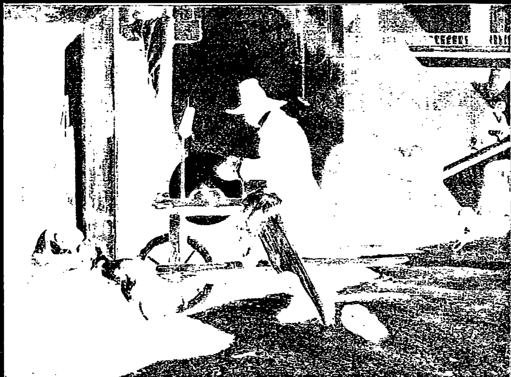
LE RÉMOULEUR, PAR DECAMPS

Qui donc, avant lui, avait regardé un mur avec tant d'amour et y