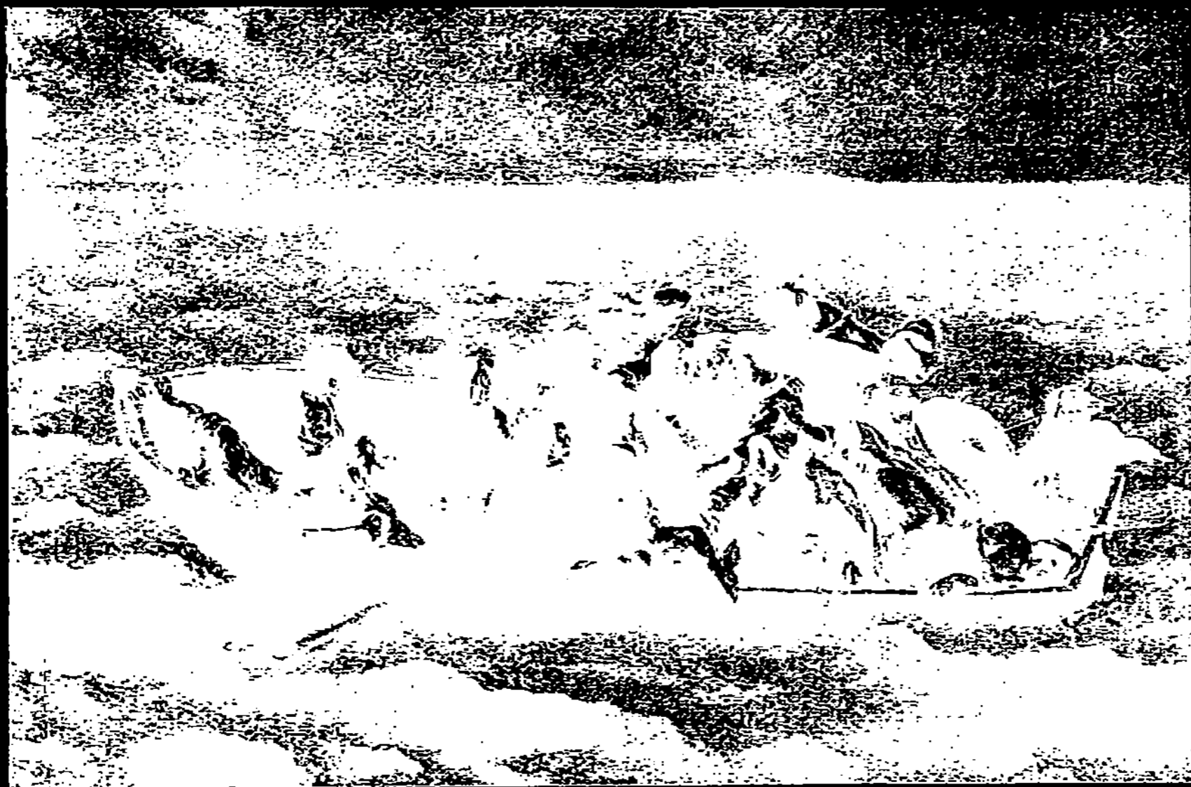
LE NAUFRAGE DE DON JUAN, PAR EUGÈNE DELACROIX (1841)

chent au passage lumières et couleurs voisines ou lointaines... Si l'on veut examiner le détail dans le détail sur un objet de médiocre dimension, — par exemple, la main d'une femme un peu sanguine, un peu maigre et d'une peau très fine, — on verra qu'il y a harmonie parfaite entre les verts des fortes veines qui la sillonnent et les tons sanguinolents qui marquent les jointures; les ongles roses tranchent sur la première phalange qui possède quelques tons gris et bruns... L'étude du même objet, vu à la loupe, fournira dans