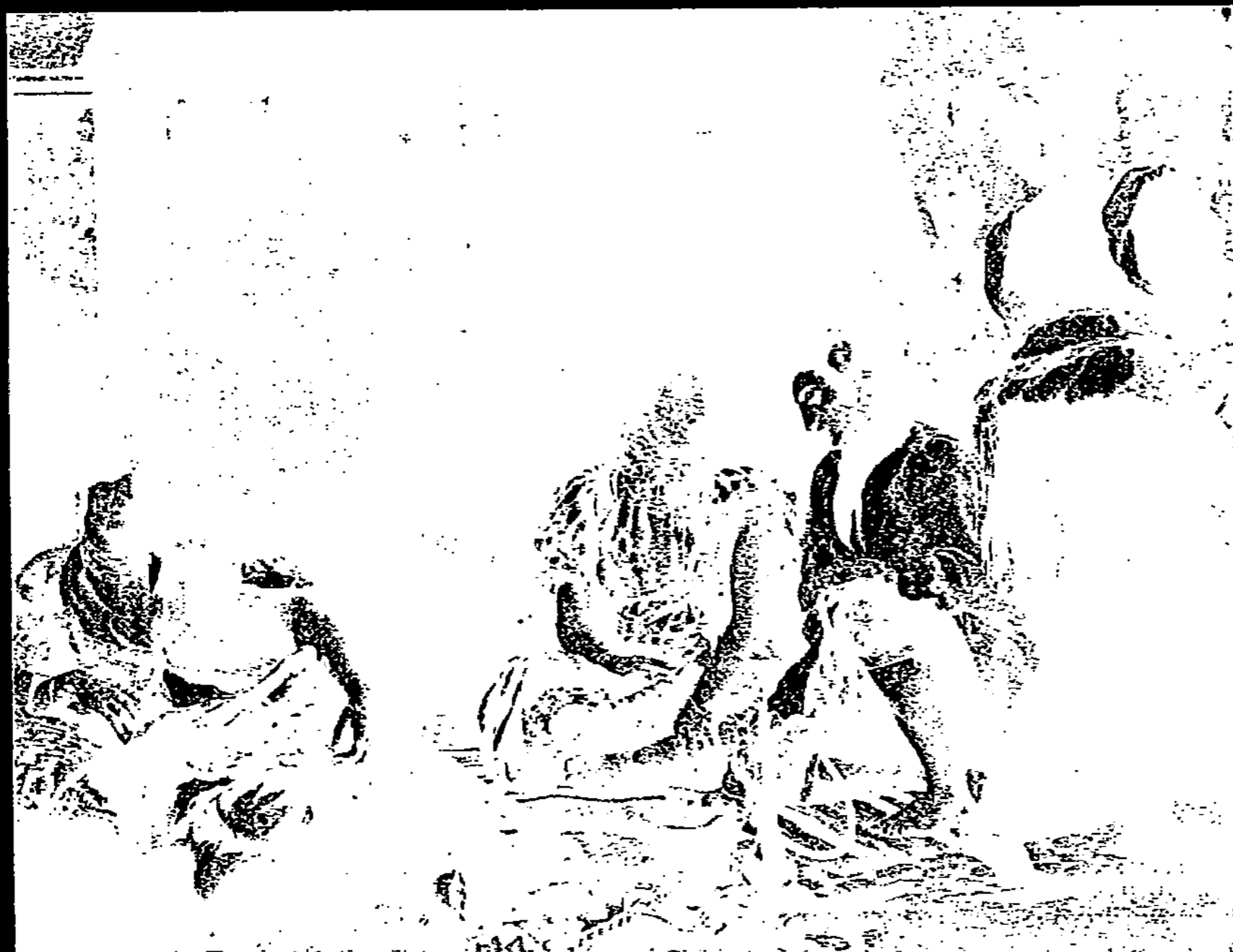
FEMMES D'ALGER DANS LEUR APPARTEMENT, PAR EUGÈNE DELACROIX (1834)