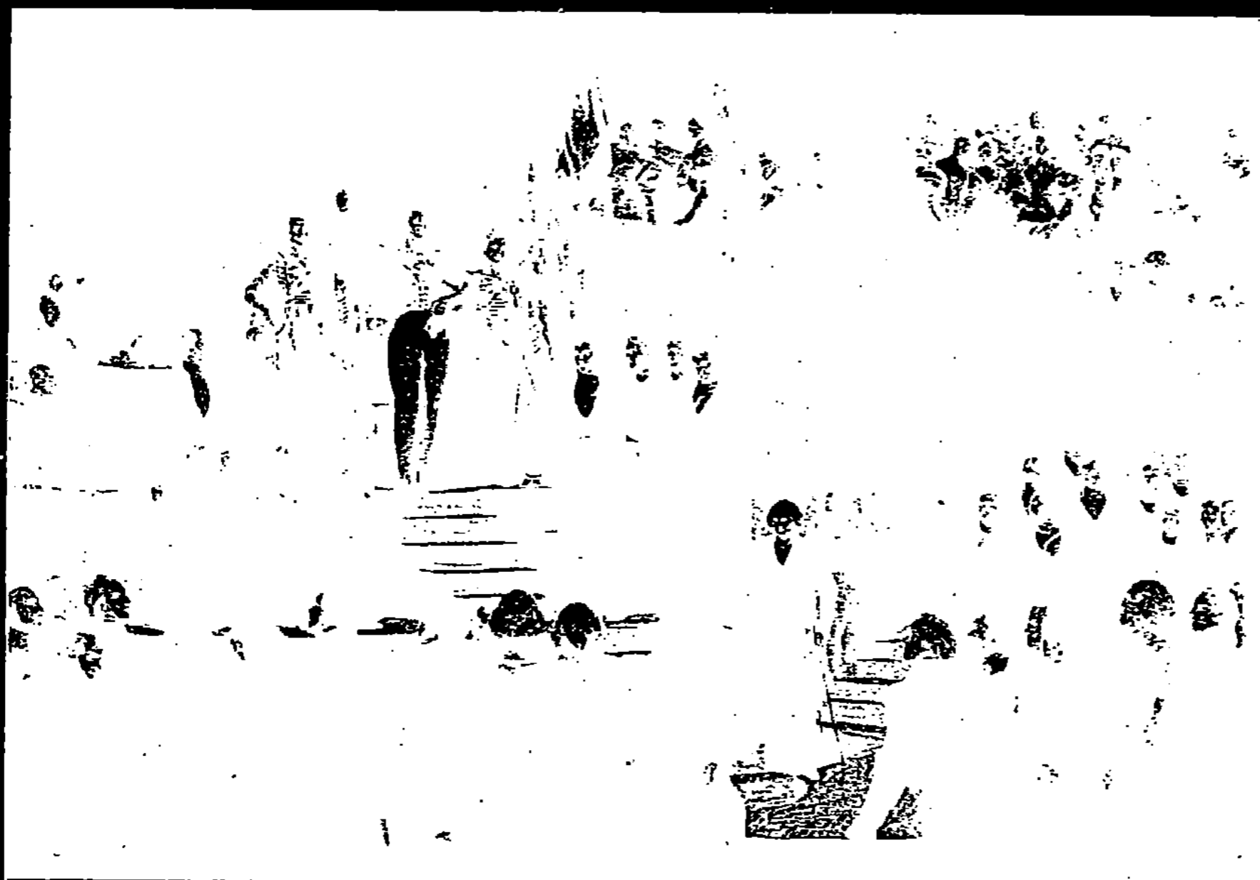
LOUIS-PHILIPPE PRÉTANT SERMENT A LA CHAMBRE DES PAIRS PAR EUGÈNE DELACROIX (Musée de Versailles.)

Voici, à présent, des artistes parmi lesquels le romantisme prend une signification amenuisée ; ils profitent de la liberté pour s'abandonner à leur fantaisie ; au métier enrichi ils demandent, avant tout, de l'agrément. Sans se cantonner dans les toiles de chevalet,