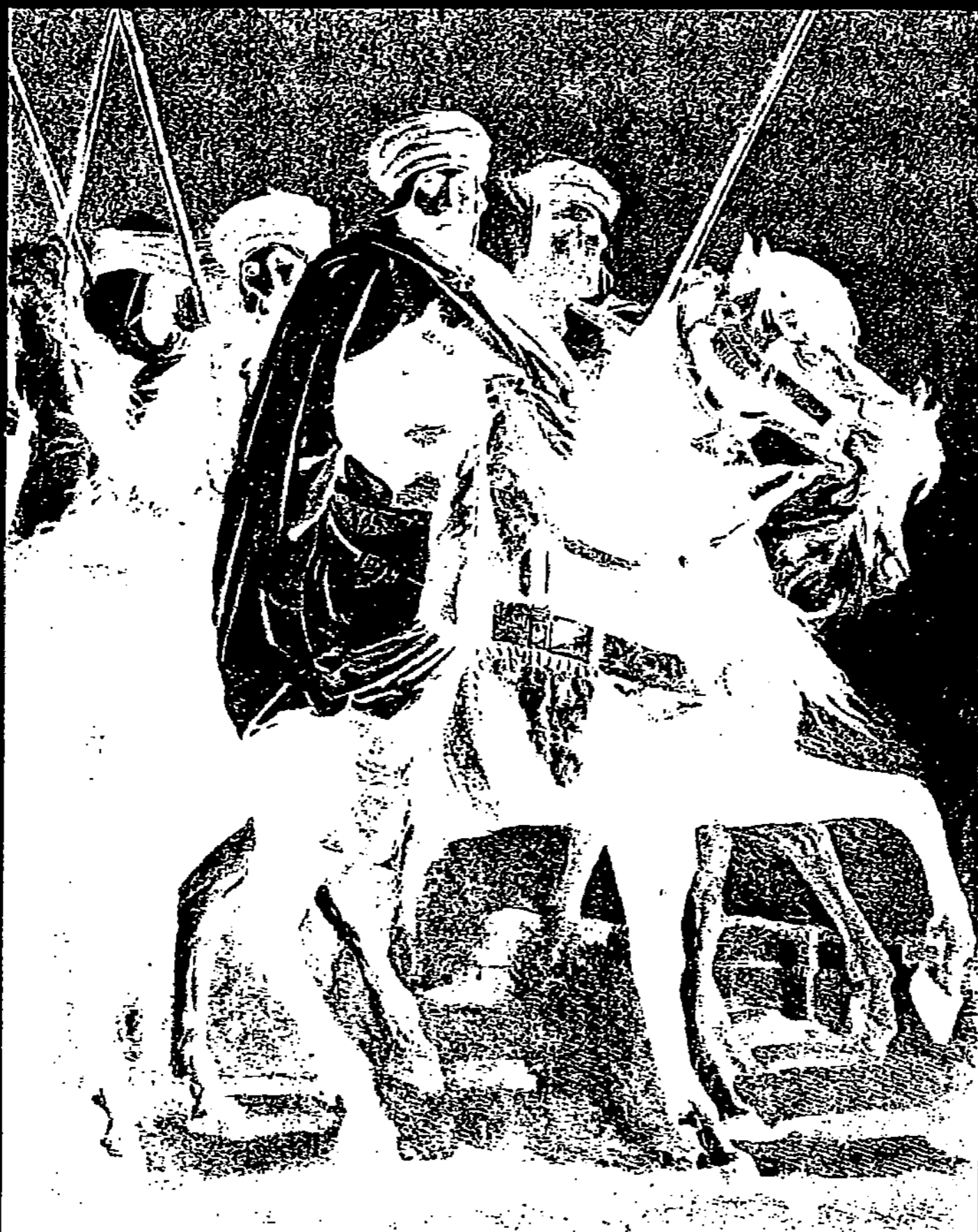
LE KHALIFE, PAR THÉODORE CHASSÉRIAU

son tempérament et il ne s'y donne pas tout entier. Si l'on examine sa production complexe, à travers tous les sujets où sa vive imagination le porte tour à tour, qu'il évoque les livres bibliques ou la mythologie païenne, qu'il chante l'Orient ou qu'il illustre Shakespeare, il apparaît bien moins préoccupé d'animer des héros ou de