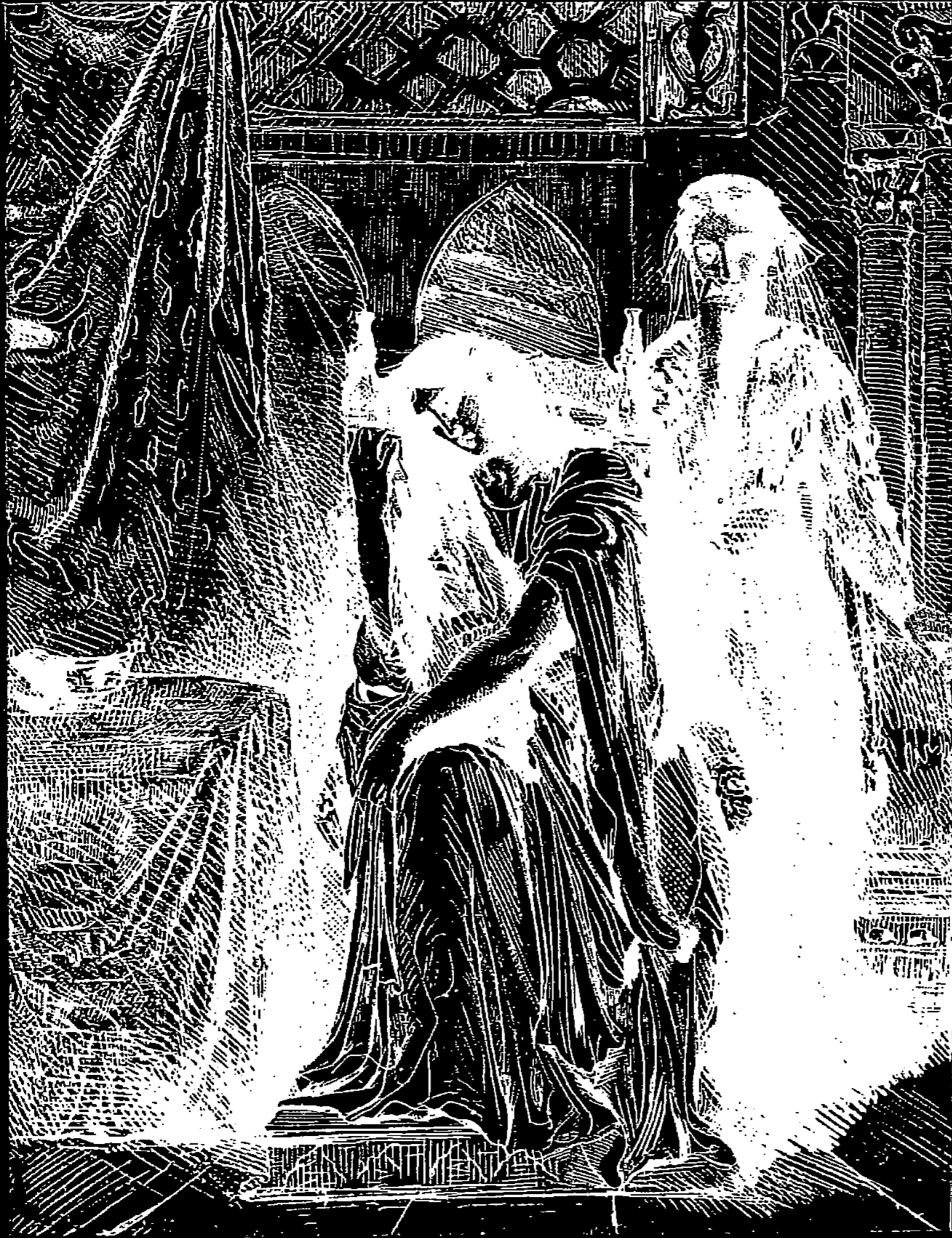
LA ROMANCE DU SAULE (« OTHELLO ») D'APRÈS L'EAU-FORTE ORIGINALE DE THÉODORE CHASSÉRIAU

sion parut à Laurent Jan 1 « moins triste que ne l'étaient d'ordinaire les productions des Ingristes ». Il y avait dans cette toile, d'une sobriété voulue, une passion qui débordait et des harmonies qui