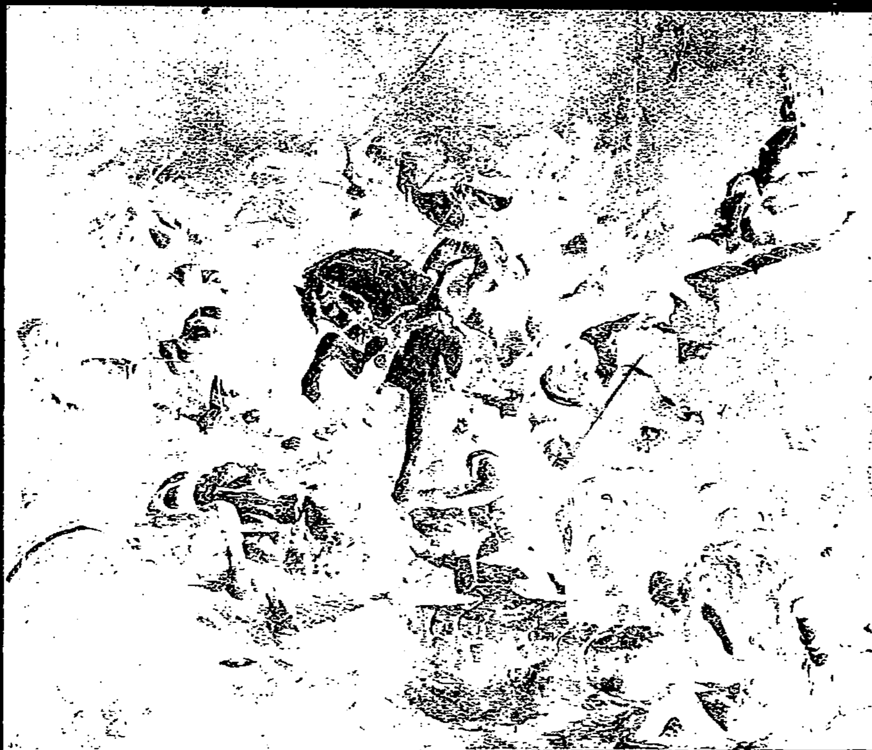
BATAILLE DE TAILLEBOURG, PAR EUGÈNE DELACROIX (1837)

Le parti pris est poussé si loin qu'il impose une tonalité presque semblable à toutes les parties de l'œuvre et la rend comme monochrome : c'est une symphonie en gris rose, résultat surprenant chez un coloriste. Il faut s'approcher de la toile, la regarder dans le détail, pour saisir les harmonies subtiles et nacrées qui se sont développées sur une gamme aussi restreinte, pour se rendre compte aussi des hardiesses qui aboutissent à cette quasi-monotonie : le cheval rose,